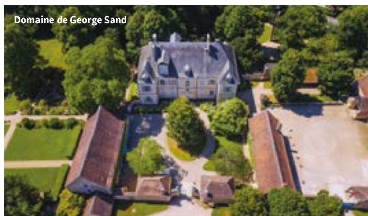
Domaine de George Sand