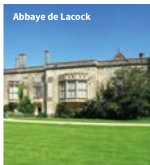
Abbaye de Lacock

REMARQUES : programme sujet à adaptation selon les opportunités/contraintes du moment. Pour des raisons indépendantes de notre volonté, les traversées pourraient se faire en bateau.